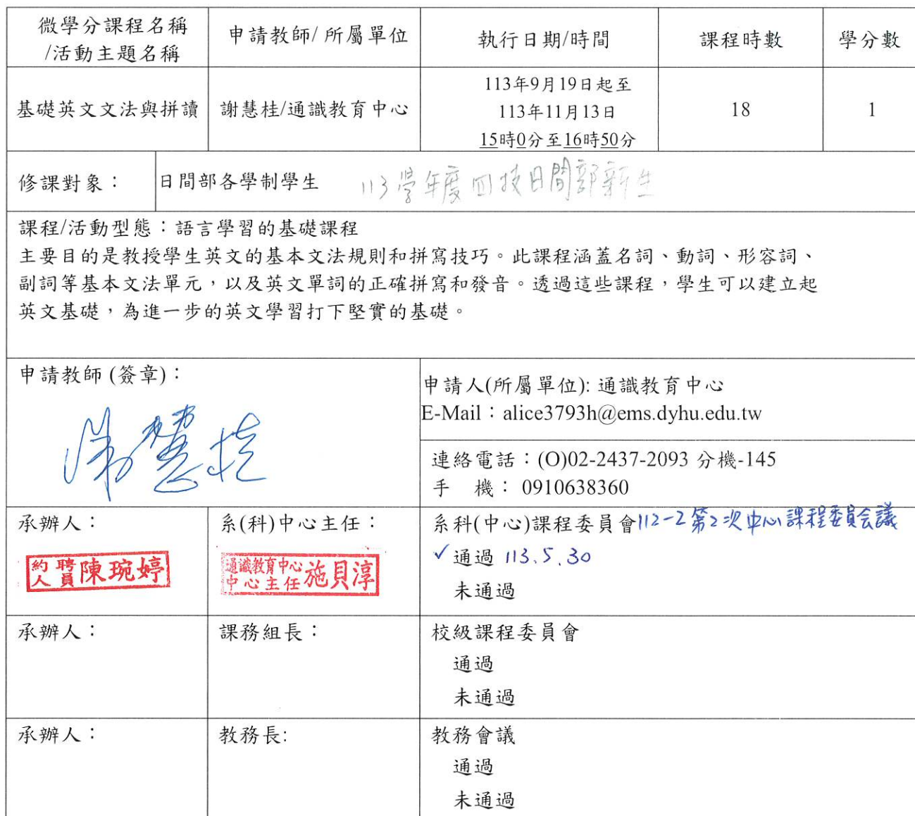
附表1：基本資料(開課教師填寫)