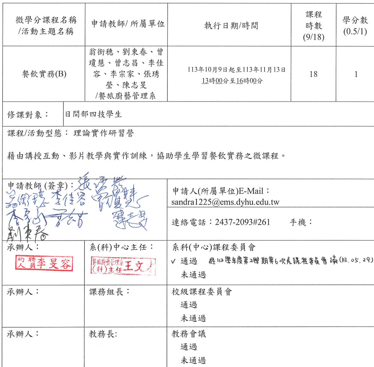
附表1：基本資料(開課教師填寫)