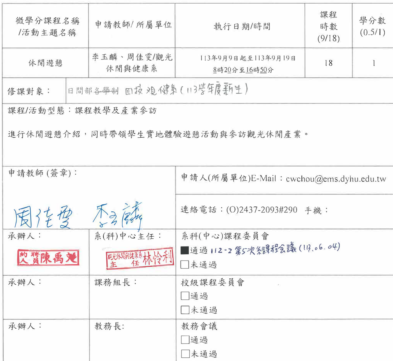
附表1：基本資料(開課教師填寫)