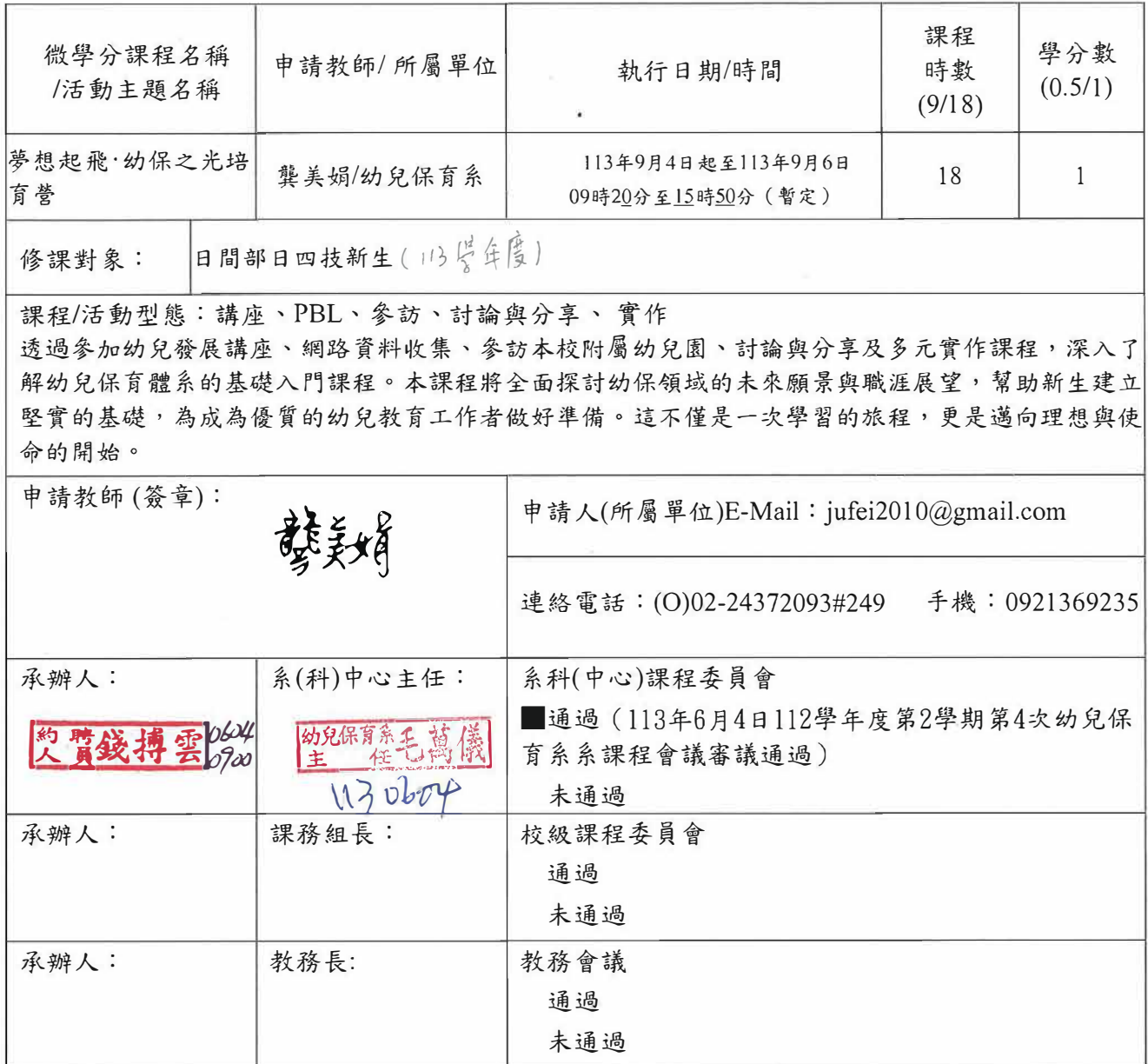
附表1：基本資料(開課教師填寫)