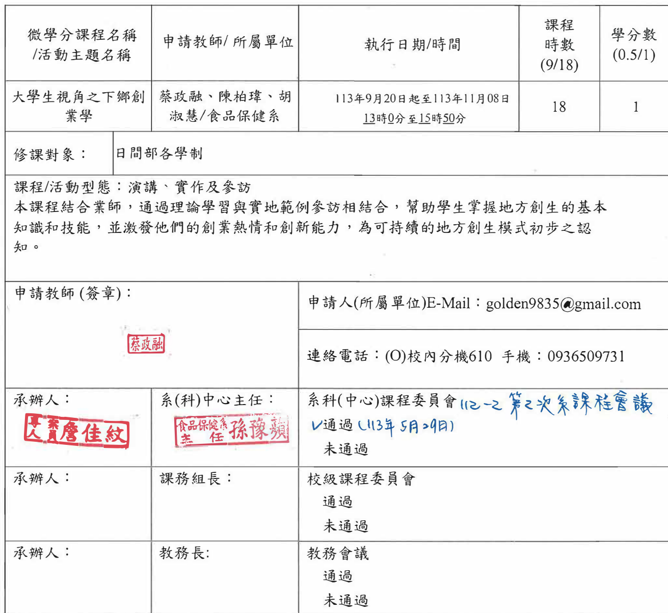
附表1：基本資料(開課教師填寫)