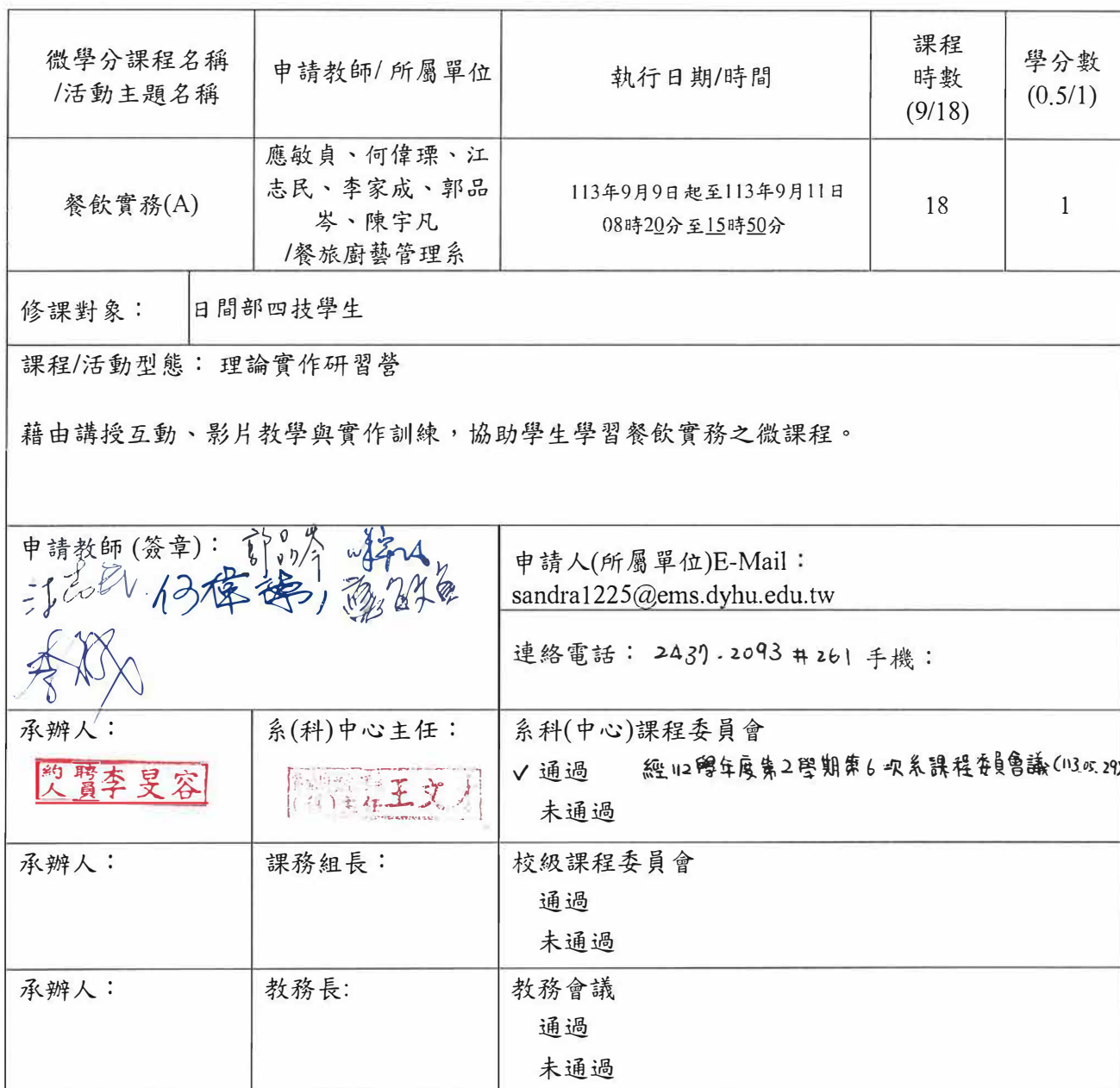
附表1：基本資料(開課教師填寫)