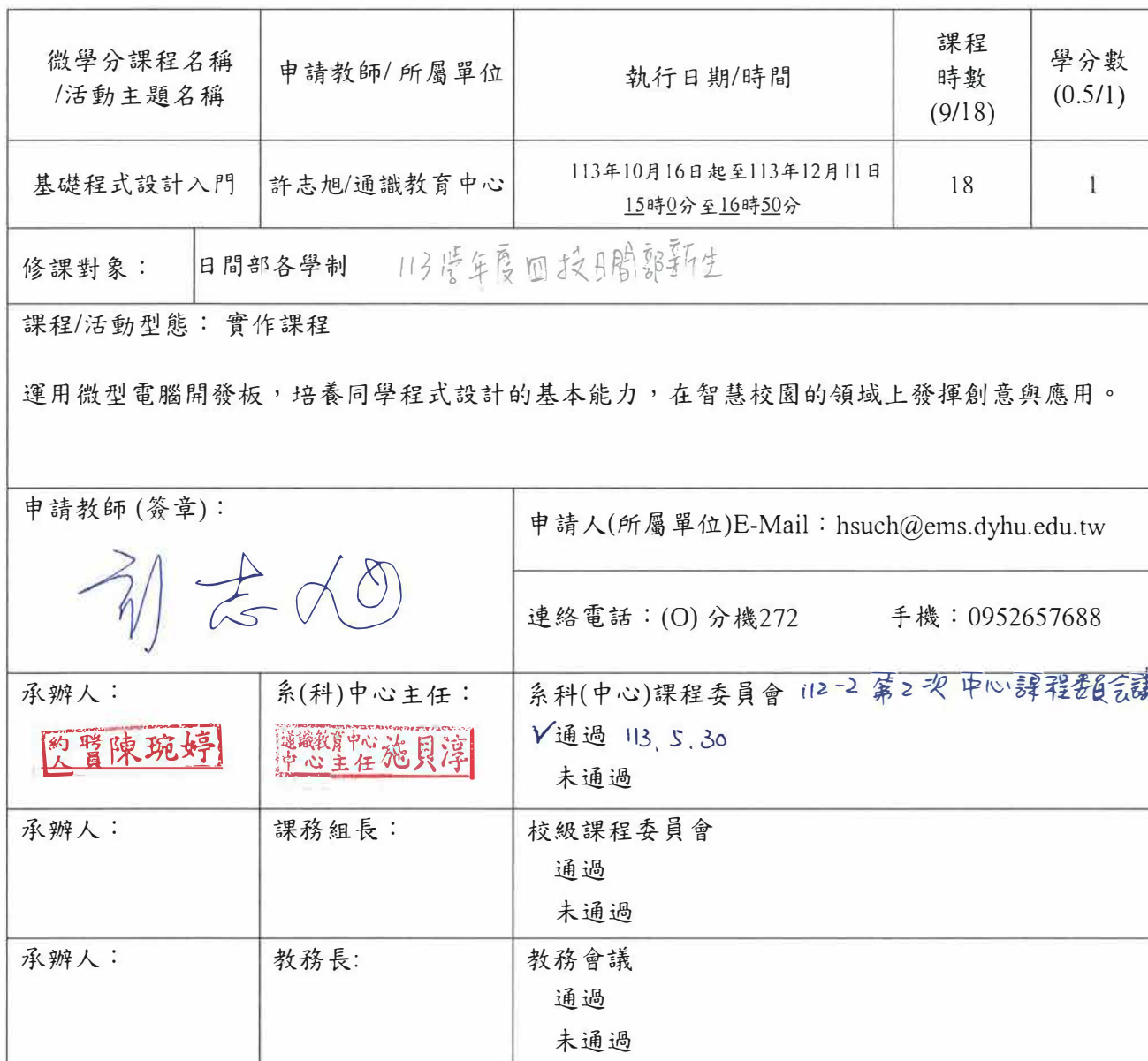
附表1：基本資料(開課教師填寫)